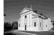
Parrocchia Purificazione B. V. Maria