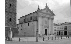
Parrocchia S. Giovanni Battista