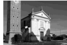
Parrocchia S. Matteo apostolo